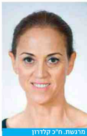
מרגשת. ח"כ קלדרון

בראוס סיפרה לכמה אנשים על החזון שלה: הקמת בית כנסת שיהיה פתוח לכו"ל, שיכלול לימודי טקסטים אינטלקטואליים ורוחניות מועצמת. "אני שואבת הרבה מהחסידות", היא מגלה במפתיע. "בש"י עוד הראשון הקראתי למשתתפים טקסט מדרש, והיריים שלי רעדו. כל כך התרגשתי מהטקסט ומהמעמד, וכנראה זה מה שעשה להם את זה". לאחר השיעור ביקשו ממנה המשתתפים שתכתוב נייר עמדה על