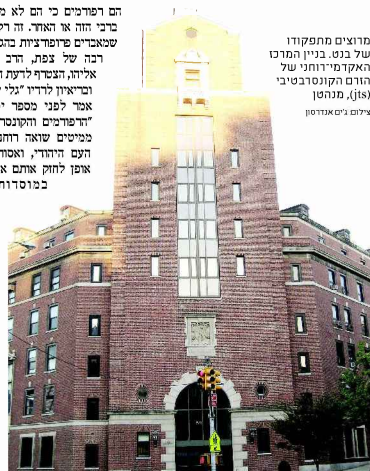
מוצאים מתפקודו של בנט. בניין המרכז האקדמי רוחני של הזרם הקונטרבטיבי (jts), מנהטן