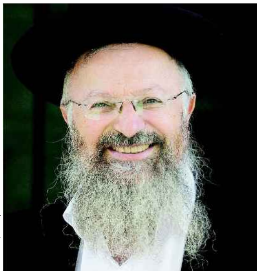
צילום: יונתן זינדל, 90 ש"א