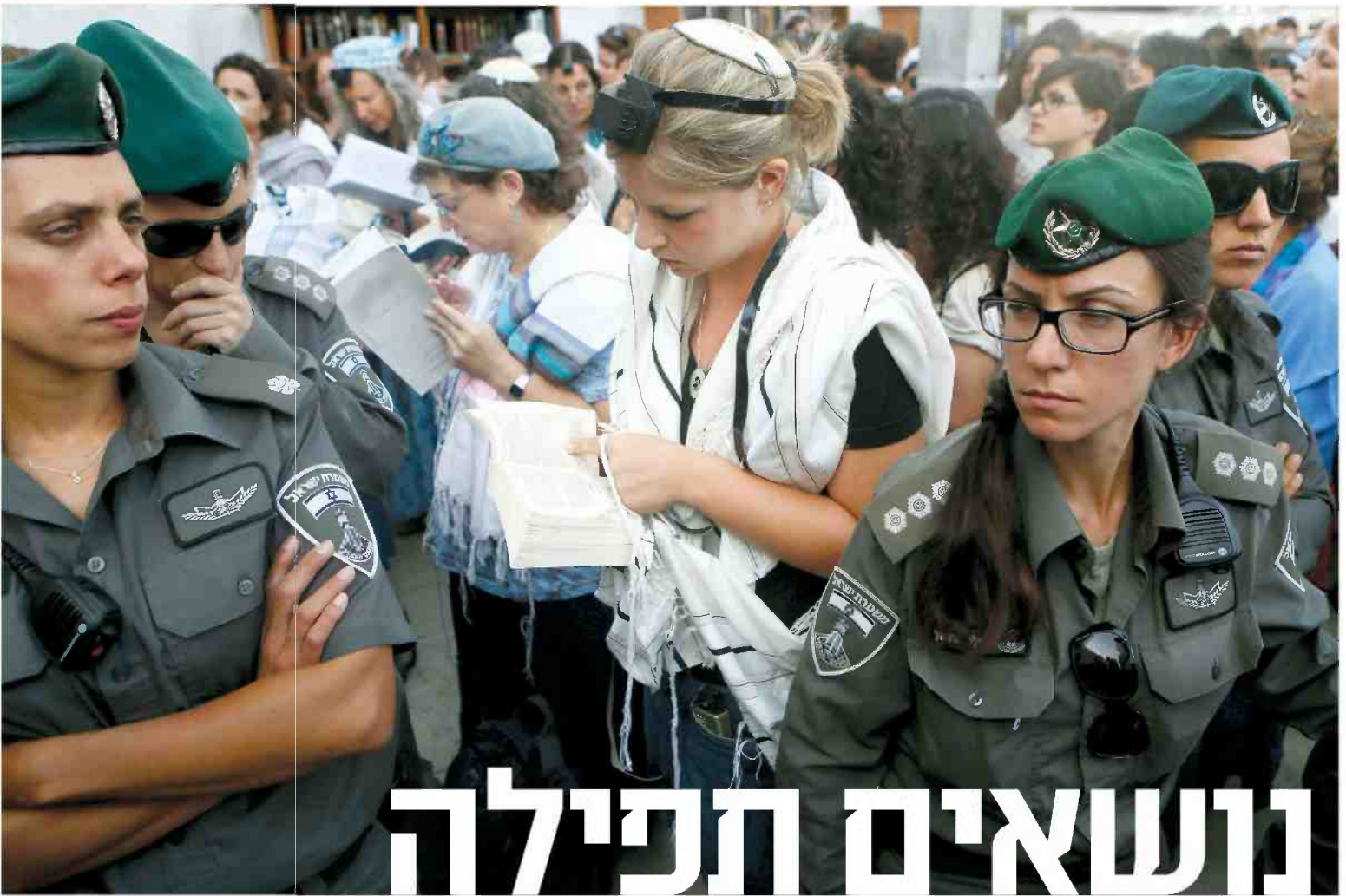
בשורה של ממש. נשות הכותל מתפללות בליווי אבטחה